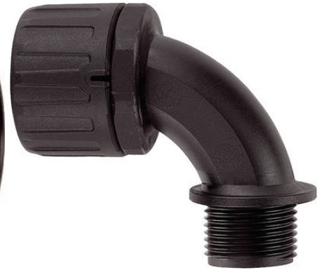
SILVYN® FPAG 90° PG